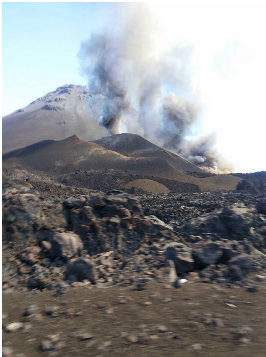
Erupción del volcán Pico do Fogo (Cabo Verde)

Gabinete de Prensa +34 922 239 510 +34 670 837 326 (guardia) F: +34 922 239 779 prensa@tenerife.es